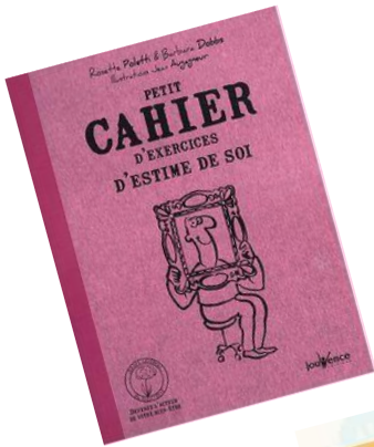
Illustration de quelques jeux/outils pédagogiques

L'intervention financière du Lions Club de Bastogne contribue à équiper l'institution en outils, en jeux de prévention et de communication ainsi qu'en matériel pédagogique en soutien à l'intervention des travailleurs sociaux.